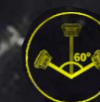
Компенсация наклона до 60°