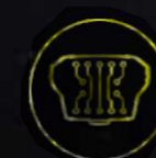
Встроенная УКВ антенна