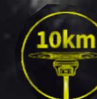
До 10 км по радио