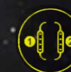
Отображение заряда батарей