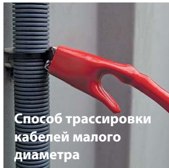
Способ трассировки кабелей малого диаметра