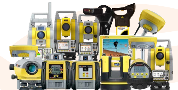
Авторизованный партнер GEOMAX

* При нормальных условиях наблюдения на поверхность с отражающей способностью 90% (Koday Grey Card) ** ИК быстрый режим *** >500м: 4 мм + 2 ррм **** на расстоянии 50 м ***** Версия Polar опционально, стандартно - -20°C до 50°C ***** Время работы батареи может быть короче в зависимости от условий. Все торговые марки и названия являются собственностью своих обладателей